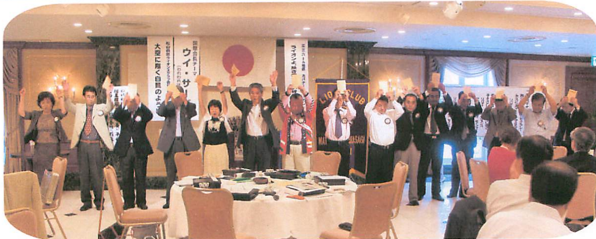
新年度役員 バッジ引き継ぎ