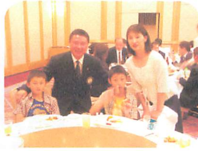
アトラクション マジック