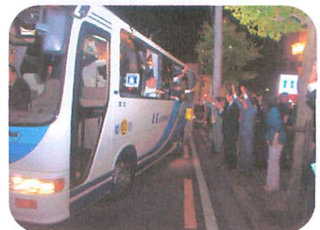
姫路白鷺LCの皆様をお見送り