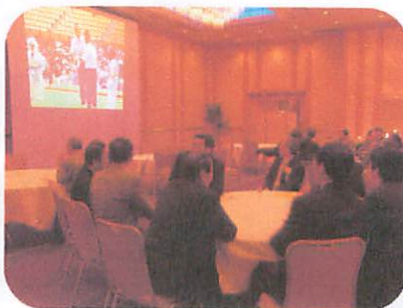
今期の活動をビデオ放映