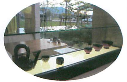
どうです?この癒される美しさ