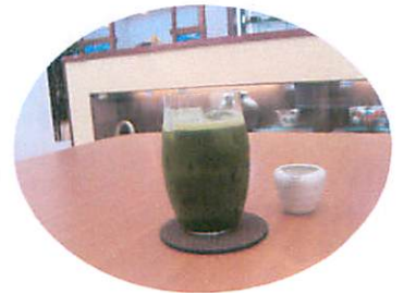
取材中ご馳走になったアイスグリーンティー、シロップ付きでしたが、入れなくても十分甘味があって、おいしかったです。

ochacafe& DINING「CHA NO HA」 オチャカフェアンドダイニング「チャノハ」 松山市南土居町556-1 Tel.089-969-0808