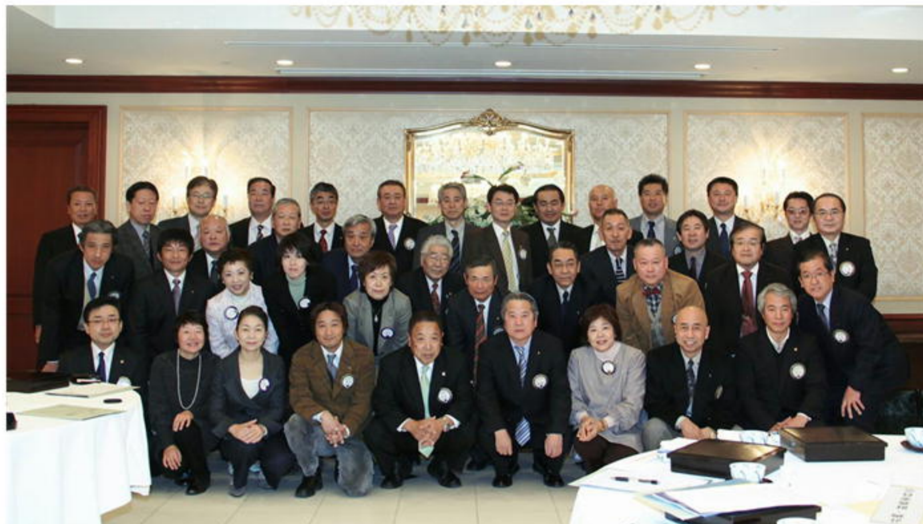
新春第1例会 2010.1.7. 於：松山全日空ホテル