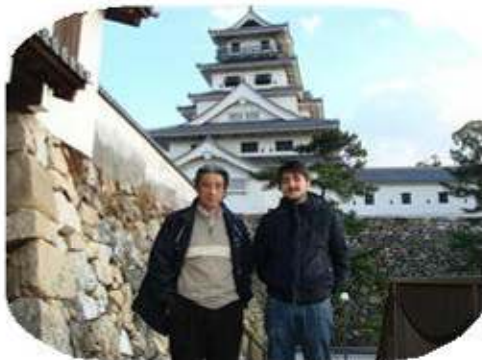
日本のお城に興味津々！