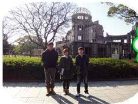
広島原爆ドームにて