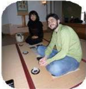
茶道で、わびさびを体験