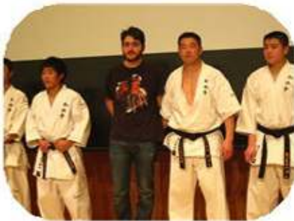
子供達と空手体験