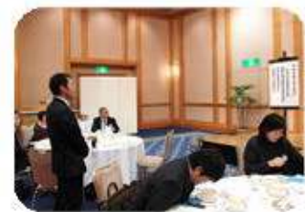
ライオンズの誓い