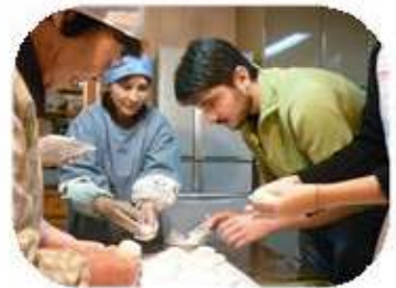
もちつき体験・・・苦戦中