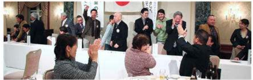
テーブル対抗リリース