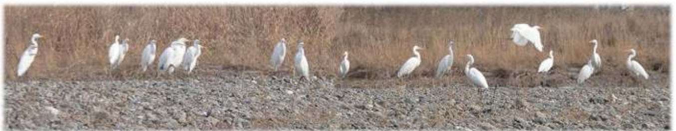
重信川橋下 河川敷にて 2011.02.07

寒さのWe love 石手川で河川清掃をしても、献血の針の痛さにも負けず、暑い太陽の下でジャガイモを掘る歓声を聞く、子供たちの空手の汗を楽しむ、そんな楽しく地域に奉仕できる笑顔のクラブライフをみんなでごせるように与えられた役割を頑張りたい。 (出来る限り委員会に顔を出します。)