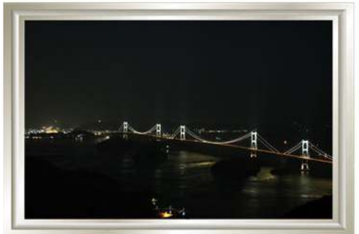
来島海峡大橋ライトアップ(亀老山から) 2010.12.23