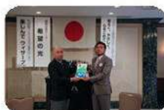
バッチ・バナーの贈呈