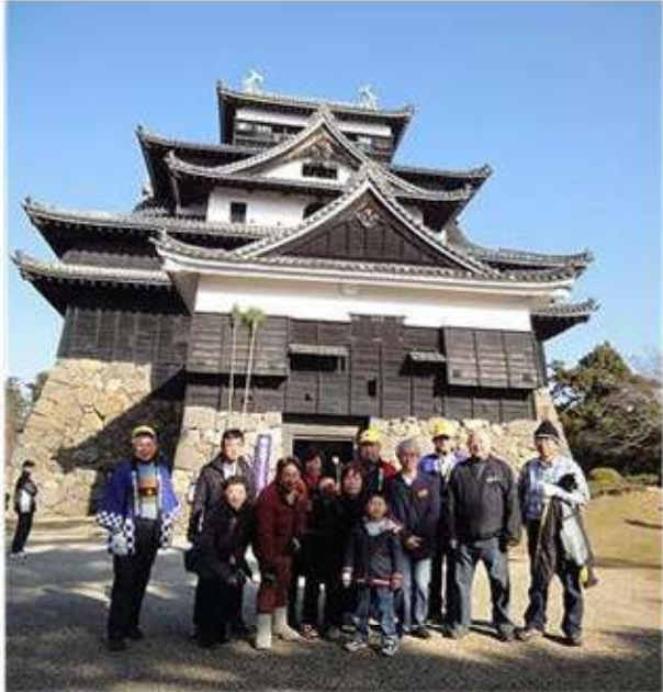
良いお天気で最高でした