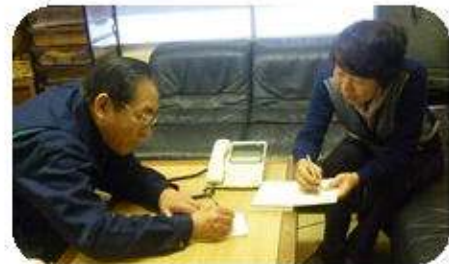
わかり易く図や表で

寛永4年（1627年）、二代目松山城主となった蒲生忠知が、領地であった故郷の近江、日野村から原種を取り寄せて、栽培させたのがはじまりといわれているそうです。赤蕪の発生地である近江の日野では現在、形は違いますが、日野菜漬として生産されています。