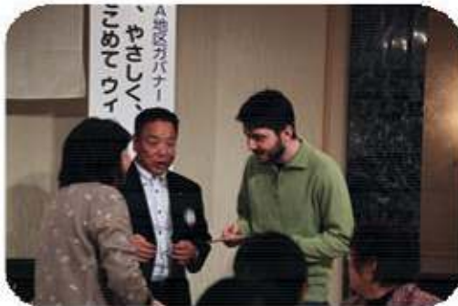
松山白鷺LCのナ-贈呈