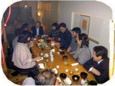
ウェルカムパーティー