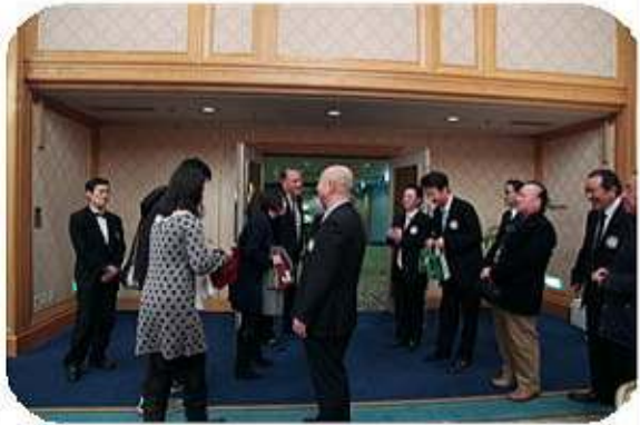
参加ご家族のお見送り