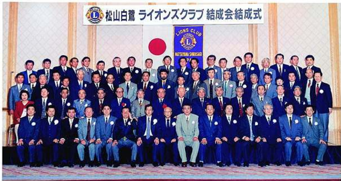
1992. 3月19日 松山白鷺ライオンズクラブ結成式 於 松山全日空ホテル