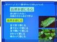
講演中のスライド