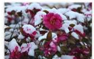
25年ぶり積雪4cm 松山城山公園 2012.02.03