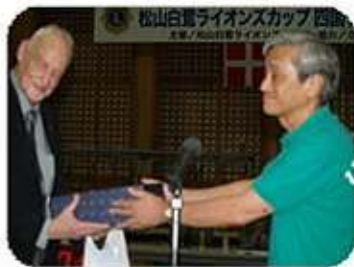
ビボーLC・松山白鷺LC 記念品交換