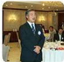
ライオンズの誓い