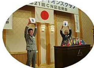
会長・幹事 お疲れ様!!