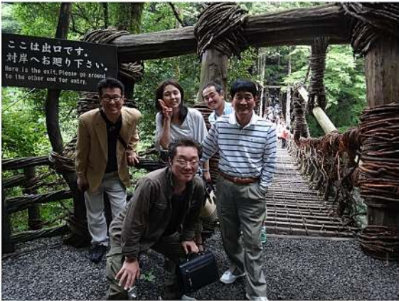
祖谷のかずら橋にて