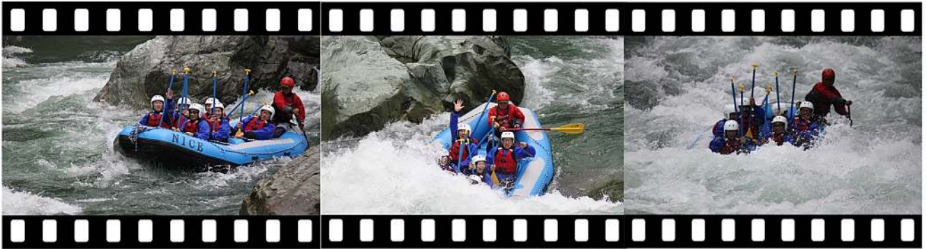
徳島県祖谷溪谷の小歩危溪流にてラフティング 計画・財務委員会旅行 2013.06.23