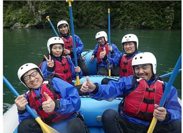
完全防備でレッツゴー！