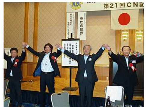
全員で心ひとつに「また会う日まで」の大合唱!!