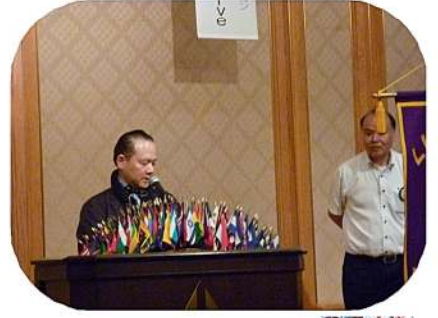
ビリケンブラザーズ