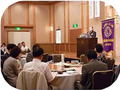
はじめての例会風景