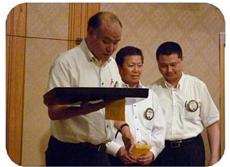
新年度役員紹介並びにバッジ引継ぎ