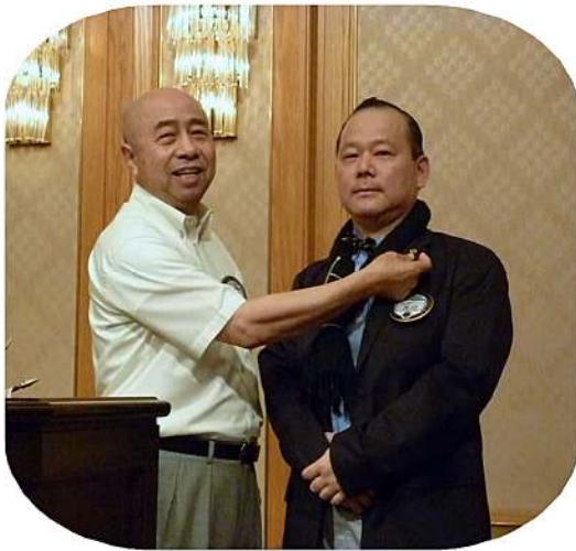
会長バッジ引継ぎ