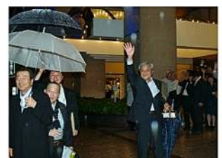
例会後帰られる姫路白鷺LCの方へのお見送り、ありがとうございました。