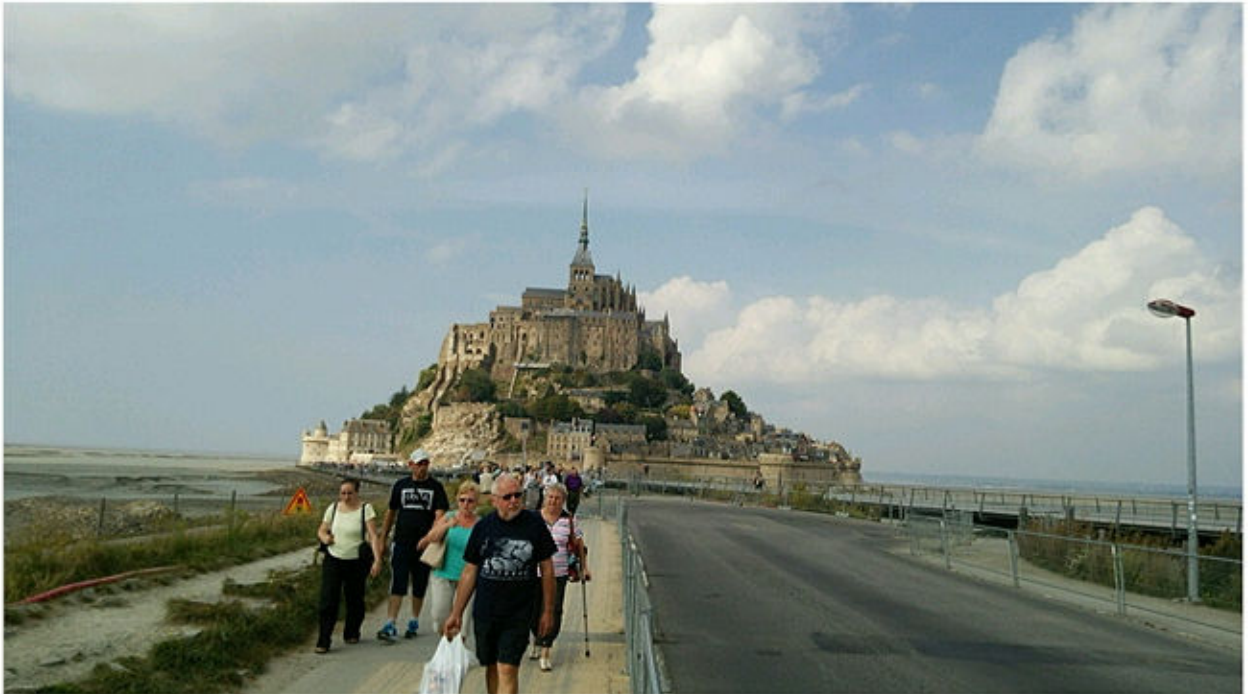
MONT SAINT-MICHELにて 2014.9.16

VOL.23 No.2 2014 November VOL.23 No.2 2014 November