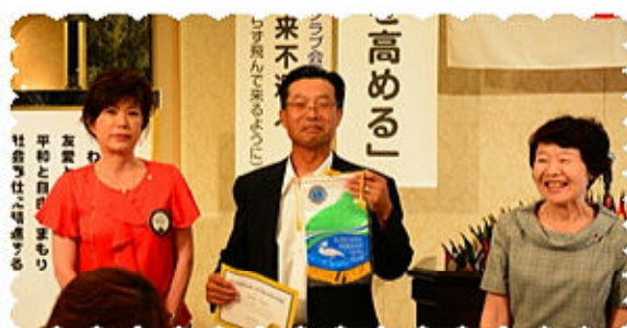
バ ッ チ ・ バ ナ ー の 贈 呈