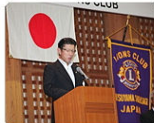
来賓挨拶 愛媛県副知事 長谷川淳二様