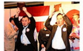
空手大会、お疲れ様