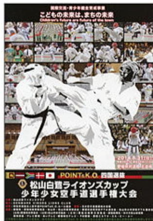
第10回大会ポスター