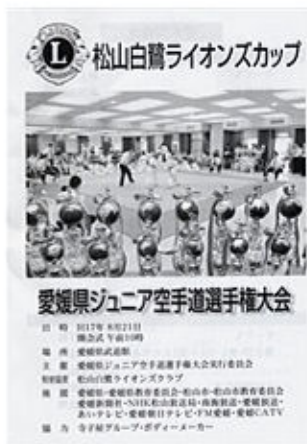
第1回大会ポスター