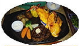
美味しくってボリューム

そして夕食はサムズバイザーというおしゃれなお肉とシーフードの店にアメリカ人(軍人?)も多く素敵な雰囲気でした。