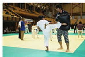
試合前の最終練習風景