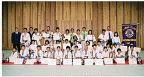
松山白鷺ライオンズカップ 愛媛県ジュニア空手道選手権大会 平成17年 8月 21日