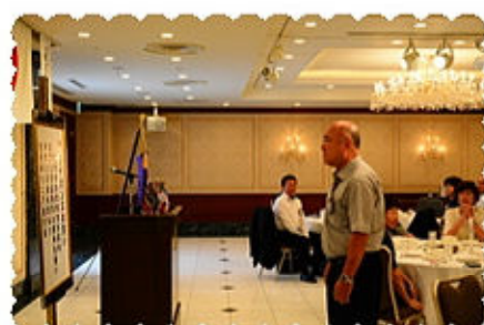
ラ イ オ ン ズ の 誓 い