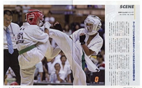
ライオンズ誌2014年10月号に掲載

2005年8月「愛媛県ジュニア空手道選手権大会」で始まり、第10回大会という節目を迎え、多数のメディアが今大会の様相を報道しました。回数を重ねるごとに参加人数も徐々に増え大規模な大会となりました。