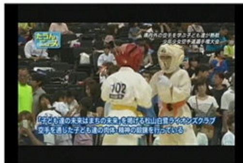
CATVで放送された一コマ

2005年8月「愛媛県ジュニア空手道選手権大会」で始まり、第10回大会という節目を迎え、多数のメディアが今大会の様相を報道しました。回数を重ねるごとに参加人数も徐々に増え大規模な大会となりました。