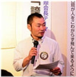
空手大会のお礼を述べる奥村委員長