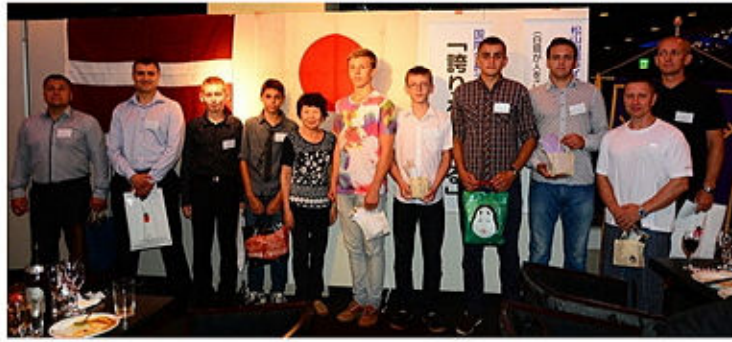
ラトビア共和国の選手団 & 藤代会長