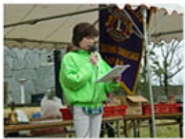
次期役員を発表する 宇治田第1副会長