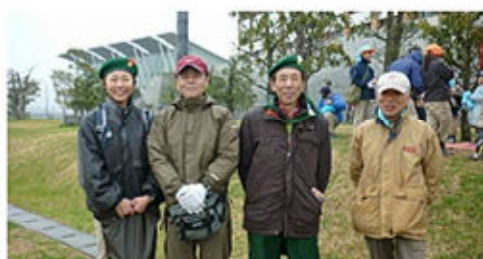
ボーイスカウトの皆さん