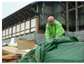
こんなに集まりました！