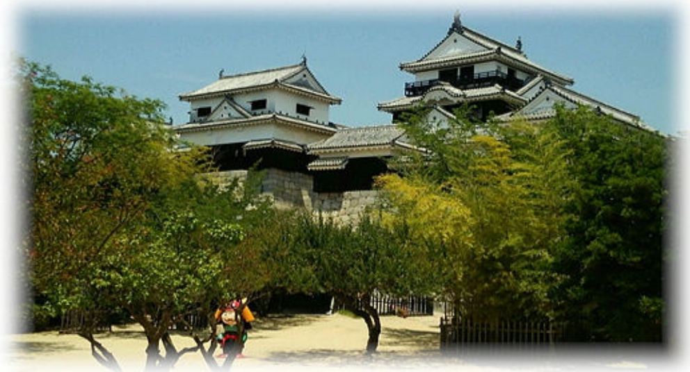
撮影 松山白鷺ライオンズクラブ PR・IT委員会 委員長 大谷 師津男

VOL.23 No.4 2015 June VOL.23 No.4 2015 June