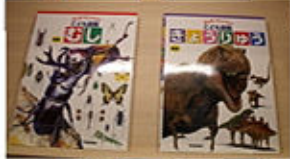
2月19日 児童図書寄贈

3月26,27日で今期2度目の献血事業を終えることができました。 1月に献血ルーム移転のお祝いに寄贈した子供用の百科事典(10冊)を本棚に置いてくださっていて、それがとても目立って嬉しかったです。ライオンズメンバーの方が自ら献血して下さった件数が増えていたことが、個々の意識の高さを感じました。一方前回ともに協力していないメンバーがいることには少し力不足を感じ、次回の課題として引き継ぎたいと思いました。 白鷺ライオンズとしても長く続いているアクティビティですのでメンバー全員が参加協力できるものにしていけたらと思います。