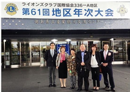
地区年次大会に参加して