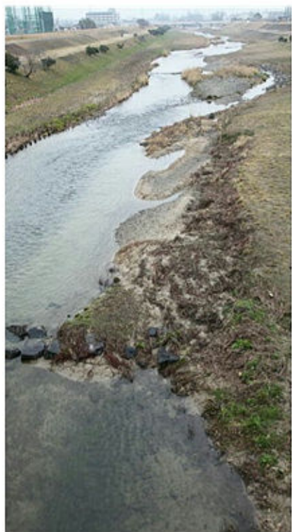
きれいになった石手川