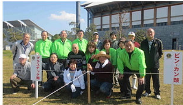
前日の参加メンバー