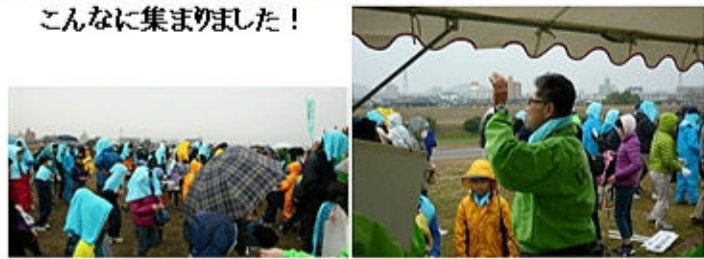
雨ニモ負ケズ終わりをマトメる梅林第2副会長